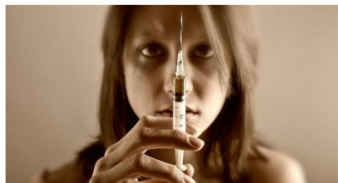
Рис.4. Интерес к наркотикам. Наркотик-ресурс совладания с проблемами.