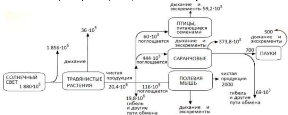
Поток энергии через небольшую часть луговой экосистемы (размерность величин: \text{кДж} \cdot \text{м}^{-2} \cdot \text{год}^{-1} )

Задание 2. Ежегодно 3 \times 10^{24} Дж солнечной энергии достигает поверхности Земли.