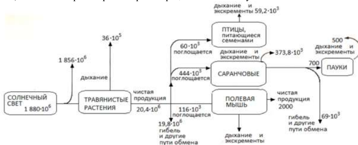
Поток энергии через небольшую часть луговой экосистемы (размерность величин: \text{кДж} \cdot \text{м}^{-2} \cdot \text{год}^{-1} )

Задание 2. Ежегодно 3 \times 10^{24} Дж солнечной энергии достигает поверхности Земли.