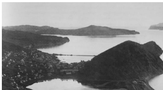
Рис. 1. Петропавловск-Камчатский в начале XX века [Hulten, 1974].