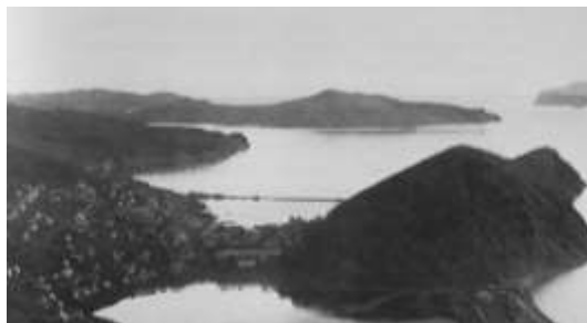
Рис. 1. Петропавловск-Камчатский в начале XX века [Hulten, 1974].